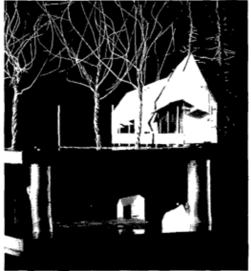
de eerste prijs

Na bekendmaken van het winnende ontwerp en de toelichting op het juryrapport was er gelegenheid in de 'Aanschouw' de tentoonge-