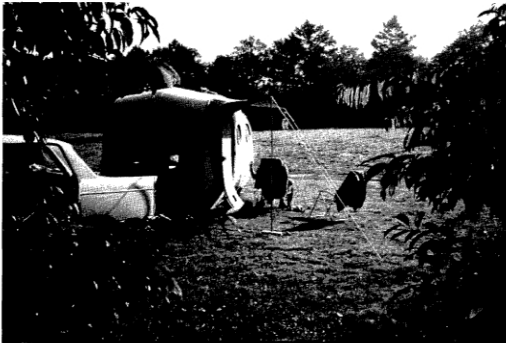
Archief Hoge Veluwe