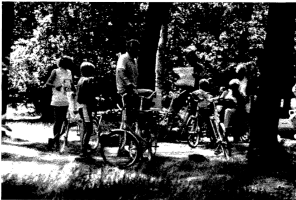
Archief Hoge Veluwe

Hoe natuurgericht is die bezoeker van de Hoge Veluwe dan? Wanneer men de wildbaan als het meest natuurlijke deel van de Hoge Veluwe aanmerkt - hier zijn naast de fietspa-