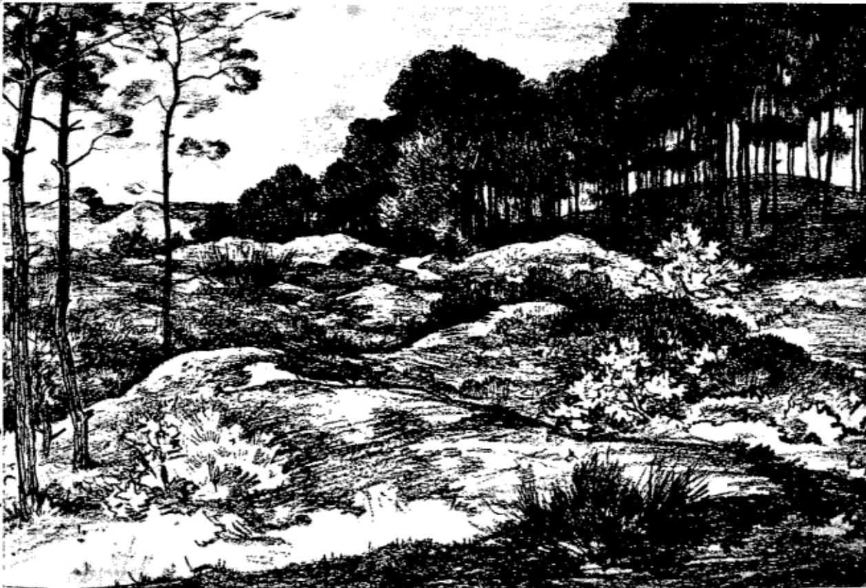
Heidelandschap met dennenbosje – tekening van E. Koning (Rijksmuseum Kröller-Müller)

Na afloop van de rondvraag dankt de voorzitter de aanwezigen voor hun belangstelling en sluit de vergadering.