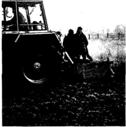
Machinaal afplaggen op Oud Reemst. De beste manier moet nog gevonden worden.

Het vervelende van een heide is dat ze niet gauw kleur bekend. Veranderingen in het beheer of milieu blijven wellicht tientallen jaren onder tafel of beter: in de bodem ver-