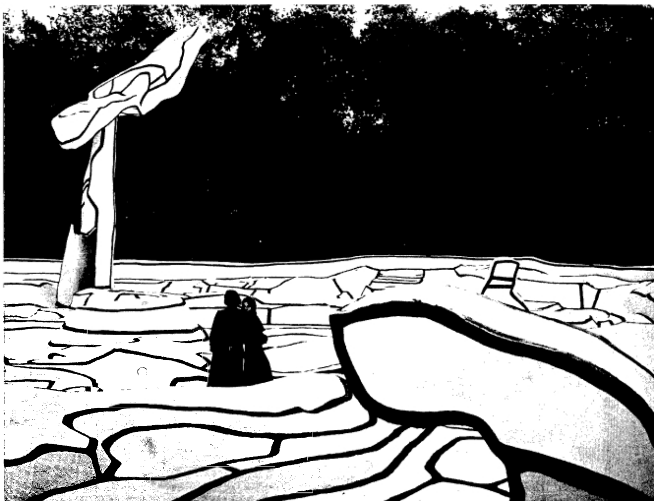
Jean Dubuffet: Jardin d'email

Het handhaven van dit evenwicht in de natuur is van het grootste belang. Wanneer het, om welke reden dan ook, werkelijk verstoord zou worden, zou al het groene blad opgegeten worden en leven op deze aarde niet meer mogelijk zijn.