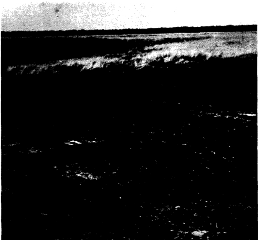
Het resultaat van machinaal afplaggen op de Deelensche Was, december 1979. De verwachting is dat hier binnen twee jaar de heide terugkomt.

kunt doen. Het moet wel nog even gezegd worden dat het op langere termijn van groot belang is meer inzicht te krijgen in de oorzaken hiervan.